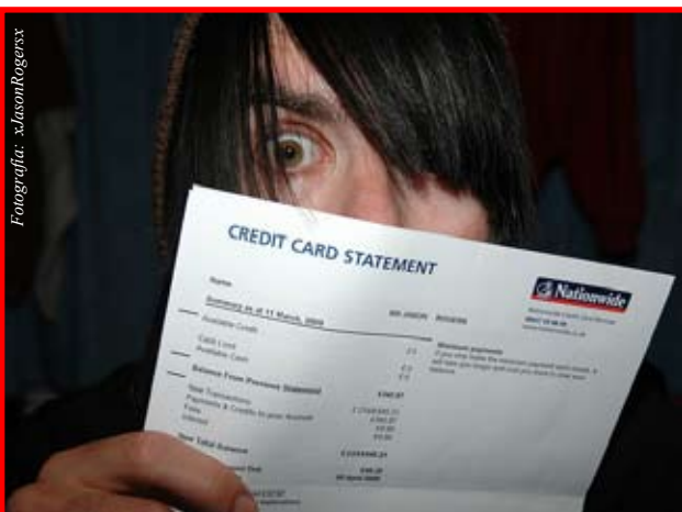
Esta es un área donde debe cuidar el manejo de su identificación