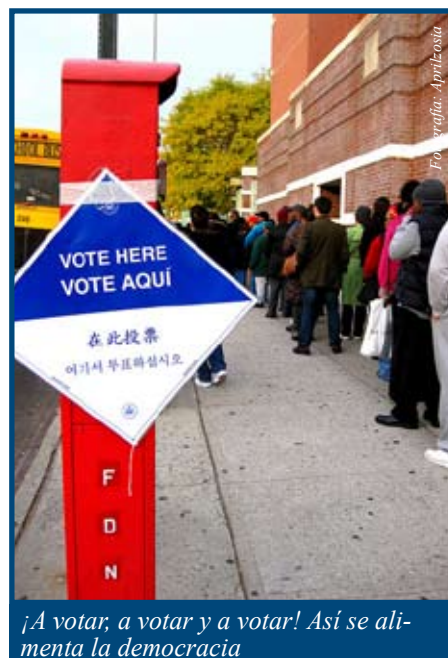
¡A votar, a votar y a votar! Así se alimenta la democracia

Al elegir un nuevo Congreso cada dos años, los electores deciden quién los representará para preparar leyes, determinar el gasto gubernamental y supervisar al Poder Ejecutivo que está encabezado por la Casa Blanca. El