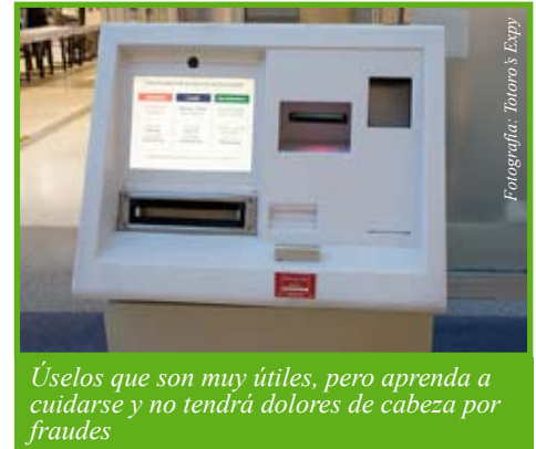
Úselos que son muy útiles, pero aprenda a cuidarse y no tendrá dolores de cabeza por fraudes

Otra manera de robarle información consiste en una mini cámara oculta detrás del usuario, a veces oculta con algún folleto de papel u otra cosa. Al obtener todos los datos que están en la tira magnética de su tarjeta, los ladrones pueden reproducir su tarjeta y utilizarla... ¡aunque usted aun la tenga en su bolsillo!