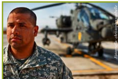
Tome nota de estos números y use la ayuda que le ofrecen

Usted puede recibir información acerca de: