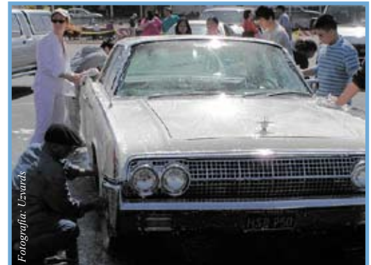
Hay ciertos tipos de trabajo más apropiados para los jóvenes

• A Sylvia, una jovencita de 18 años, se