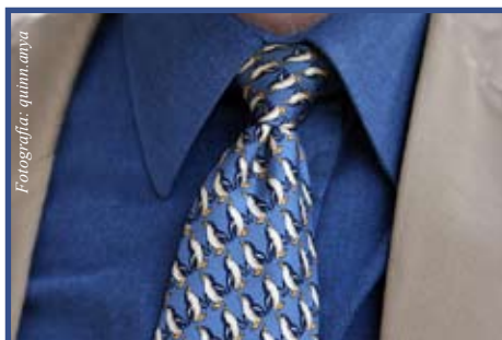
Algunos hábitos son mejores que otros a la hora de impresionar al empleador

Muchas veces cuando buscamos empleo, de alguna forma nos traicionamos a nosotros mismos con actitudes no adecuadas para lograr el objetivo. He aquí algunos consejos donde los expertos parecen coincidir: