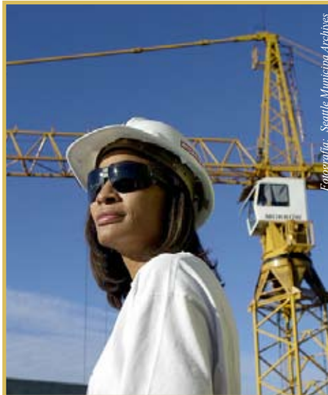
En EEUU, existen leyes que reglamentan este aspecto para cuidar a la juventud