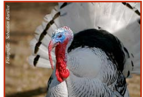
La tradición no ha cambiado. Esa noche se come pavo como cada en 1621