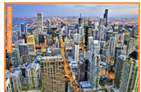
Las ciudades son entes con vida propia y pueden ser muy distintas en cuanto a oportunidades

Las regiones donde se juntan dos o más ciudades grandes también tienen la tendencia de ofrecer una