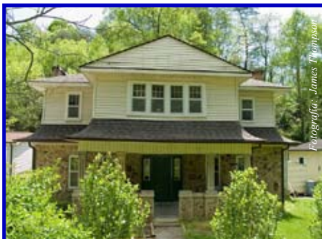
¿Esta pensando comprar una casa?

A la hora de comprar, mucha gente se pregunta si la mejor inversión es comprar la casa con el terreno más