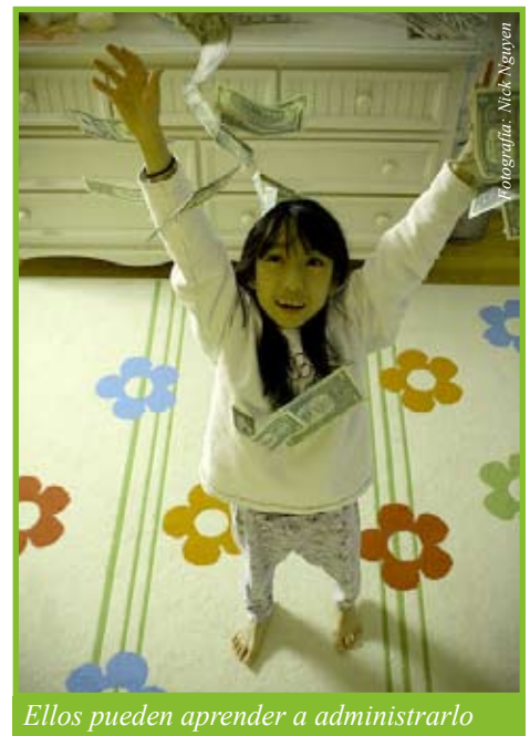
Ellos pueden aprender a administrarlo

El gobierno tiene en Internet un excelente sitio educativo en español, donde usted puede aprender a cuidar de su propia economía y obtener ideas para enseñarles a sus niños: www.mymoney.gov/espanol