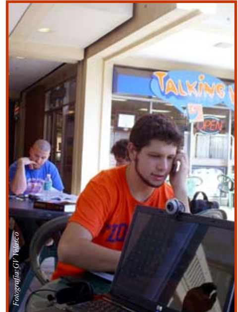
El poder de esta maquina puede cambiar la vida

Según Dan Lips de la Heritage Foundation , hoy en día, 27 estados ofrecen escuelas donde los estudiantes pueden tomar clases a través del Internet, y 25 permiten escolaridad de tiempo completo. Entre los proveedores importantes de educación virtual (por Internet), podemos mencionar programas como K-12 y Connections Academy , y un creciente número de proveedores en internet, pueden ser encontrados en sitios como Hippocampus.org. Muchos utilizan sistemas