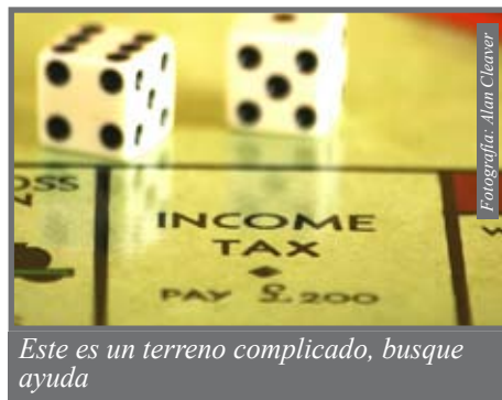
Este es un terreno complicado, busque ayuda

Se supone que el Congreso de los Estados Unidos está trabajando en una reforma a este ya complicado tema. La mayor parte de los congresistas están de acuerdo en que el gobierno debe cobrar impuestos al heredero, como se ha hecho hasta ahora cuando una persona muere y le deja sus posesiones materiales. Sin embargo, este tema es complicado y confuso para casi todos, y cuando alguien fallece y