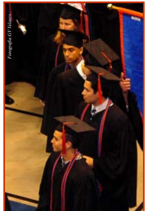
Relativamente pocos hispanos llegan aquí en EEUU

(La mano amiga agradece al Lexington Institute por su contribución con este editorial. Para leer más artículos sobre educación, visite www.lexingtoninstitute.org )