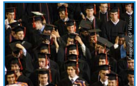
Ellos necesitan un mejor mapa del futuro

son: Texas, Virginia, Colorado, Carolina del Norte y Massachusetts. Este tipo de estudios toma en cuenta factores como el costo y la facilidad de instalar un negocio, la disponibilidad de mano de obra y la de gente con buena educación académica, la disponibilidad de buen transporte e infraestructura, la economía del lugar y el costo de vida, y la capacidad de ser un lugar amistoso para nuevas empresas.