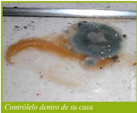
Contrólole dentro de su casa

Está formado por hongos que pueden encontrarse en exteriores o interiores. Crecen mejor en condiciones cálidas, mojadas y húmedas, así que si tiene lugares mojados o húmedos en su casa, probablemente también tenga hongos.