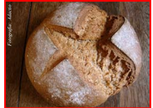
Este pan podría estar carcomiendo su salud

Los síntomas pueden variar de una persona a otra, esto es parte de la razón por la cual el diagnóstico no