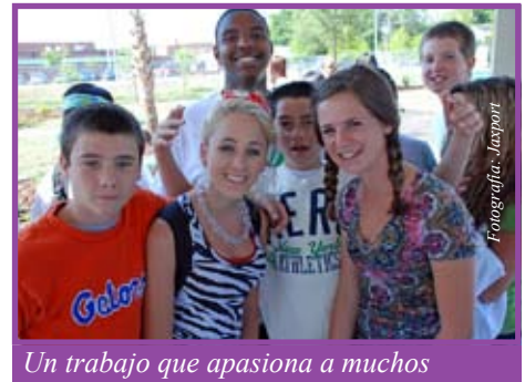
Un trabajo que apasiona a muchos

El Centro Nacional para Reclutamiento de Maestros ( National Teacher Recruitment Clearinghouse ) ofrece un servicio por Internet para ayudar a los maestros en su búsqueda de empleo (información disponible en inglés). http://www.recruitingteachers.org