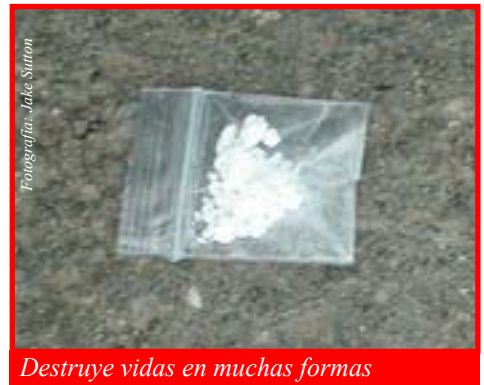
Destruye vidas en muchas formas