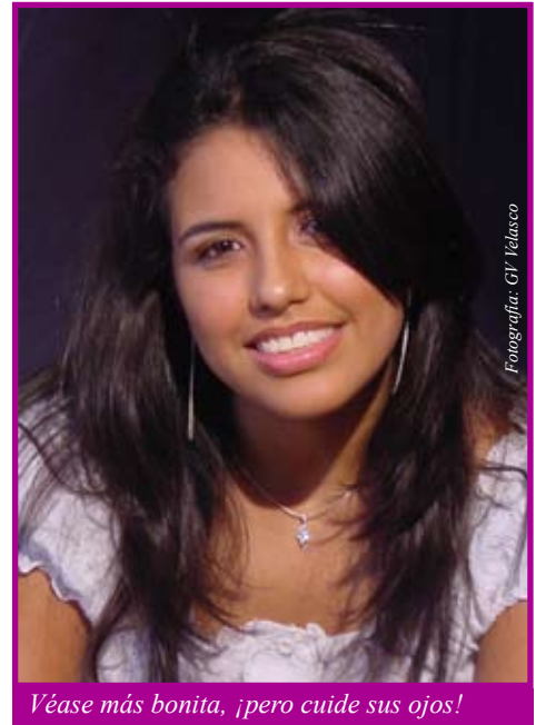
Véase más bonita, ¡pero cuide sus ojos!

Los gérmenes de otras personas pueden ser riesgosos para usted. Recuerde esto cuando pase por una tienda y vea que existen cosméticos