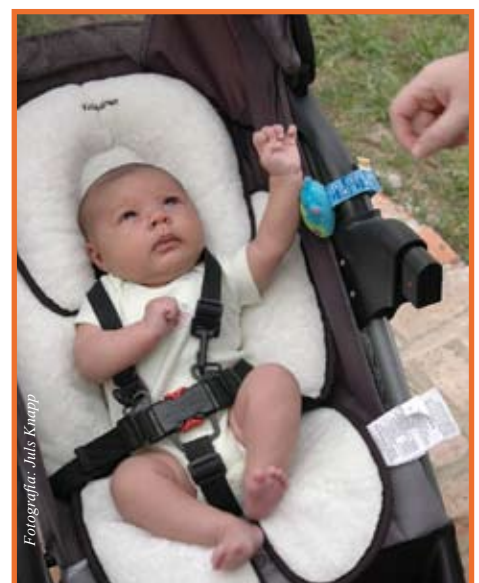
Les gusta y les sirve que usted les hable

Quizá este estudio pueda convencer a los fabricantes de coches para que vuelvan a hacerlos como antes, pero entre tanto, usted no olvide que su bebé comienza su formación desde antes de nacer — y ahora que ya nació, ¡no pierda oportunidad de tomarlo en cuenta y conversarle!