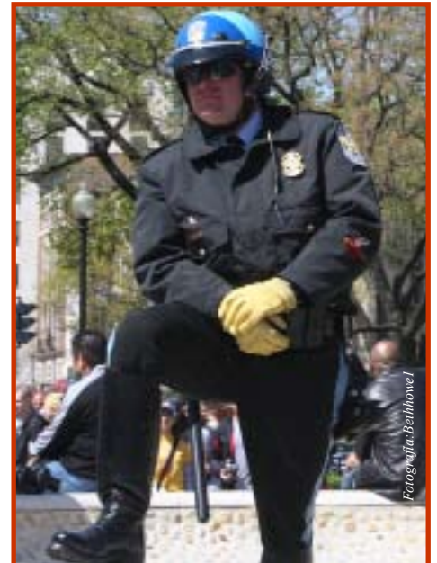
El alcohol y el volante pueden convertirlo en criminal

Entre las cosas que toda persona debería saber sobre este delito, es que se convierte en ilegal en el instante en que el contenido de alcohol en la sangre (BAC, por sus siglas en inglés) es de 0.08% o superior, pero cuidado, la mayor parte de los estados tiene una medida más baja aún, que se llama “cero tolerancia”, y los