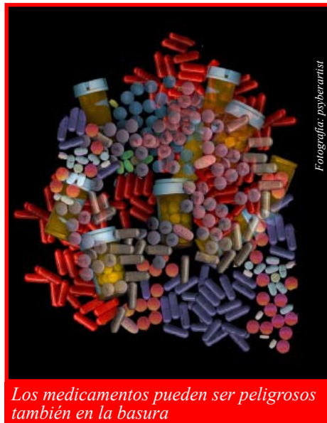
Los medicamentos pueden ser peligrosos también en la basura

Según la Agencia del Gobierno Federal encargada de administrar los alimentos y medicamentos (FDA, por sus siglas en inglés), algunos medicamentos deben arrojarse al inodoro, y un número creciente de programas comunitarios de “recuperación” ofrecen ahora esta alternativa para la eliminación segura.