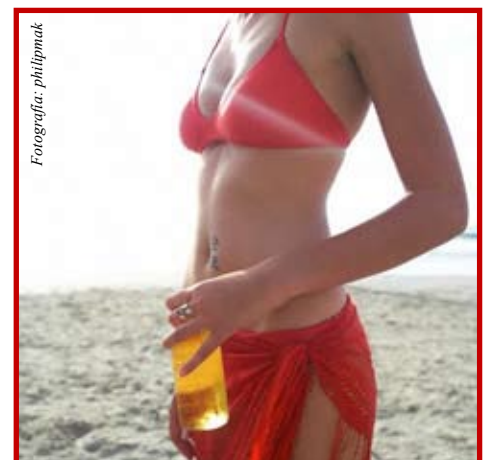
Hay razones para no beber de joven

adolescentes creen que el alcohol es inofensivo y bueno, siendo que es un peligro disfrazado de algo “normal” dentro de nuestra sociedad.