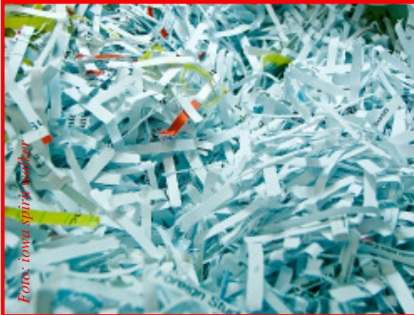
Destruir documentos es una forma de prevenir el robo de la identidad.

En el transcurso de un día agitado, usted puede hacer un cheque en una tienda, comprar boletos para un partido de fútbol con su tarjeta de crédito, alquilar un auto, enviar por correo su declaración de impuestos, cambiar de proveedor de servicio de teléfono celular o solicitar una nueva tarjeta de crédito. Es muy probable