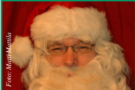
La tradición navideña en los Estados Unidos, tiene su propio sabor.