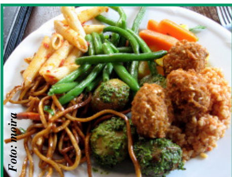
Un plato sin carne puede ser igualmente delicioso.

Es difícil invitar a cenar a algún amigo mejicano o argentino y convencerlo de que en la cena no habrá carne en la mesa, pues en Latinoamérica existen