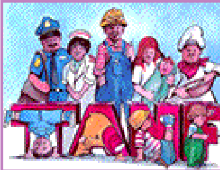
Un programa singular: TANF.

El Programa de Asistencia Temporal para Familias Necesitadas (TANF, por sus siglas en inglés) asigna fondos a los Estados, Territorios Y Tribus, esta ayuda tiene límites de tiempo, y está diseñada para ayudar a las familias de una manera que permita lograr razonablemente los objetivos de este programa.