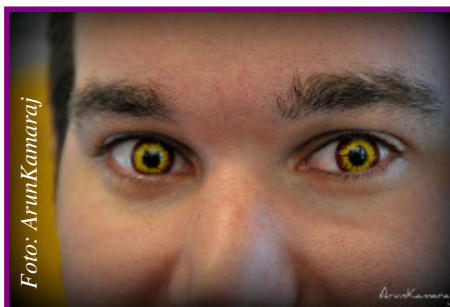
Los lentes decorativos requieren el mismo cuidado que los de receta.

La hija de unos amigos ha descubierto el gusto de cambiar el color de sus ojos y ha convencido a mi hija de que esta es una moda moderna e interesante. Bueno, no le veo mayor problema, sin embargo, he encontrado unas palabras