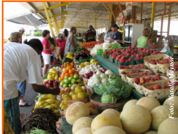
Ahorrar sin bajar la calidad de la alimentación, es posible.

donde usted puede ubicar agricultores comunitarios de su zona: http://www.localharvest.org/csa/ En el mapa