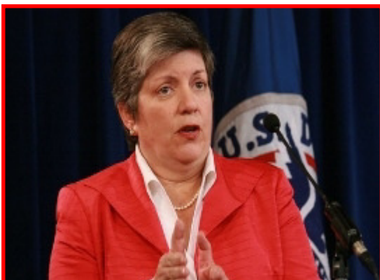
La Secretaria Napolitano propone alternativas a las cárceles.