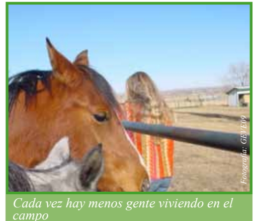
Cada vez hay menos gente viviendo en el campo

Fuentes: 1997 Censo Agrícola de 1997 ; USDA.Programas Aggie Bonds / 2009