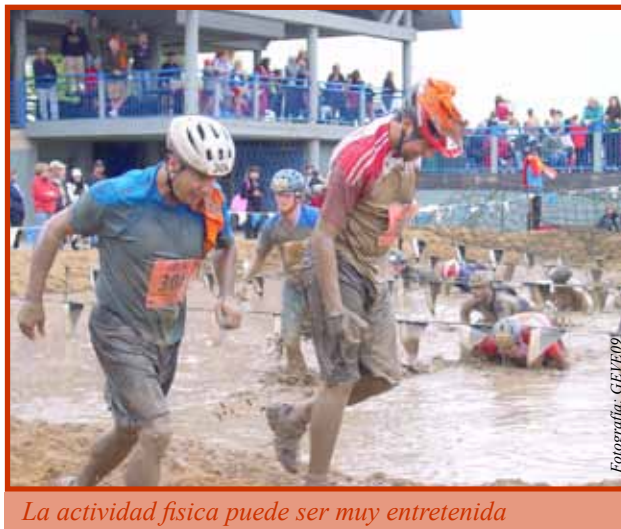
La actividad física puede ser muy entretenida

Esto se puede lograr con un simple trote o una caminata apurada, de diez minutos, tres veces al día. La mayor parte de la gente puede incluir esto en su vida diaria.