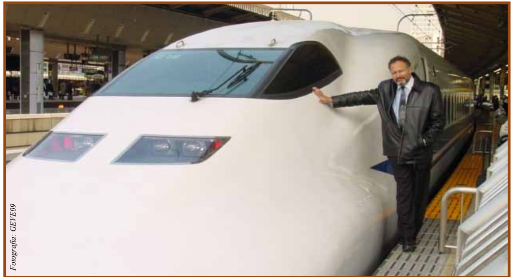
Adaptese a los nuevos tiempos, piense diferente

E stamos en una etapa extraordinariamente especial en la economía de los Estados Unidos. Para salir bien de esta recesión, es importante que comprendamos que el mundo ha cambiado.