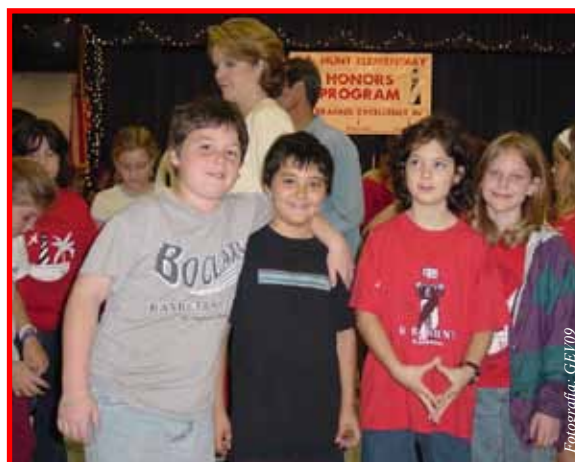
Se puede ahorrar en varias formas, para el futuro de los más chicos

Las personas que buscan que su dinero ahorrado gane intereses y prefieren inversiones de bajo riesgo que puedan ser fácilmente transformadas en dinero en efectivo, frecuentemente optan por adquirir un Certificado de Depósito (CD). Este es un tipo de transacción especial que se abre en un banco o una institución financiera de ahorros. EL CD tradicionalmente paga una tasa de interés más alta que lo que ofrece una