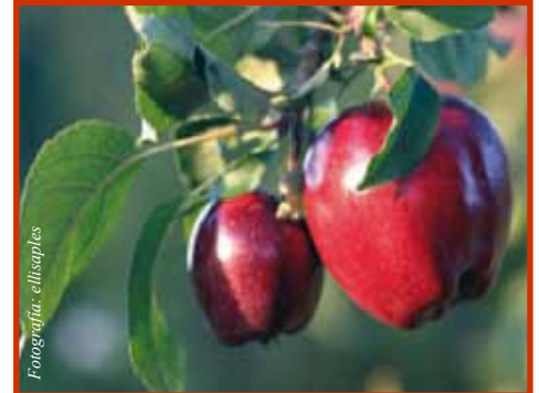
Las manzanas del estado de Washington