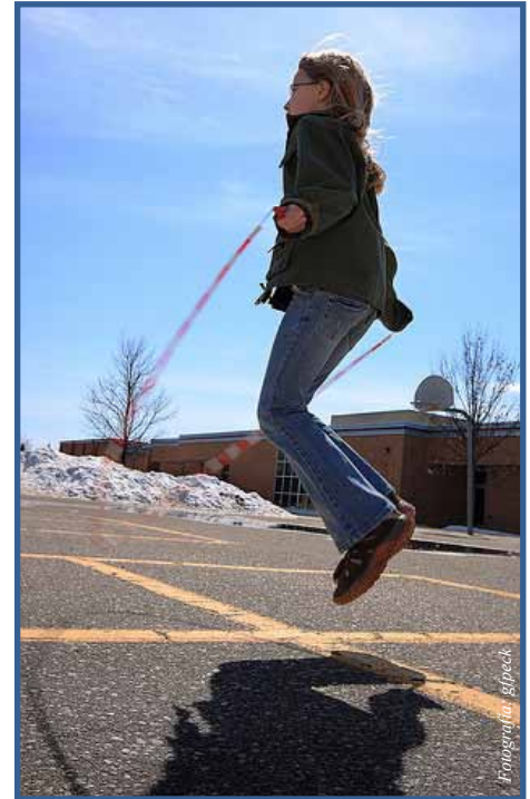
Inspire a sus hijos para que les guste la actividad