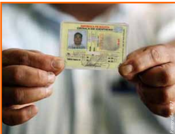
Usar una identificación falsa es delito serio