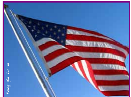
Tomar ciudadanía nueva es tomar aprecio por un nuevo suelo

Programa de comidas escolares, en Internet http://www.fns.usda.gov/cnd/sp-default.htm