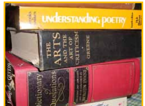
No descuide su aprendizaje del inglés

Mucha gente se cree ya “muy vieja” para aprender un idioma. Mentira, en otras culturas, como la europea, la gente continúa aprendiendo idiomas nuevos hasta sus 70 u 80 años, así que ¡no se engañe, usted puede! Use bien su tiempo de aprendizaje y verá cuán rápido avanza.