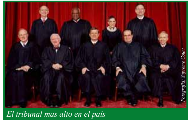
El tribunal mas alto en el país

Ahora que Sonia Sotomayor ha ganado su designación en el Congreso, tendrá el poder para influenciar muchas decisiones en el país. Este es un cargo que no tiene un periodo determinado y general-